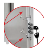
Закрытая внутренняя панель двери